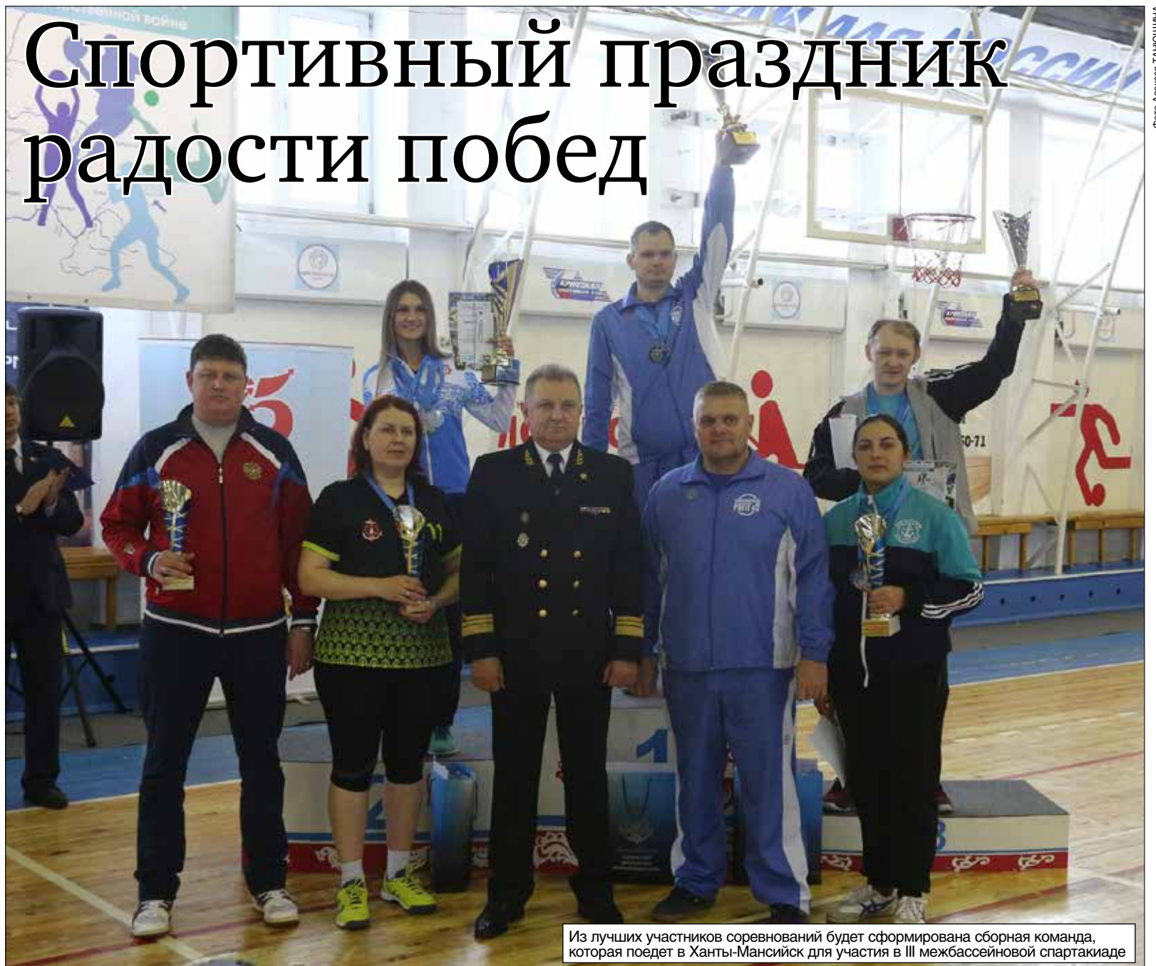
Из лучших участников соревнований будет сформирована сборная команда, которая поедет в Ханты-Мансийск для участия в III межбассейновой спартакиаде

В феврале в семнадцатый раз прошла Спартакиада путейцев Обского бассейна. В этом году она была посвящена 75-летию Победы в Великой Отечественной войне.