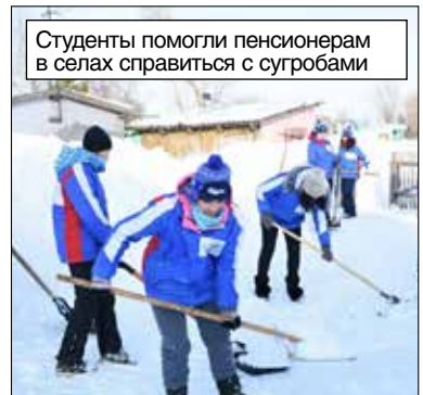
Студенты помогли пенсионерам в селах справиться с сугробами