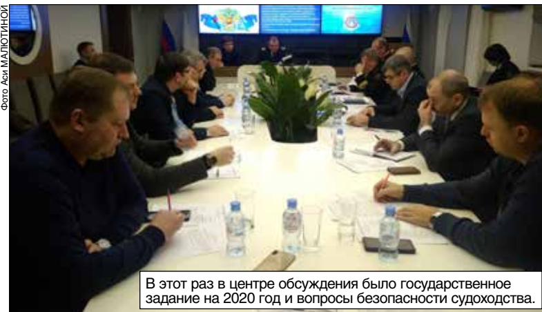
В этот раз в центре обсуждения было государственное задание на 2020 год и вопросы безопасности судоходства.

Работа на этом участке сегодня требует комплексного подхода — упор только на проведение дноуглубительных работ продлит период навигации лишь на небольшой период времени. Обеспечить увеличение пропускной способности внутренних водных путей, при которой баржебуксирные составы будут эксплуатироваться с полной загрузкой в течение всего навигационного периода, возможно при условии реализации мероприятий «Комплекс мероприятий по улучшению судоходных условий (увеличению габаритов судового хода) на участке