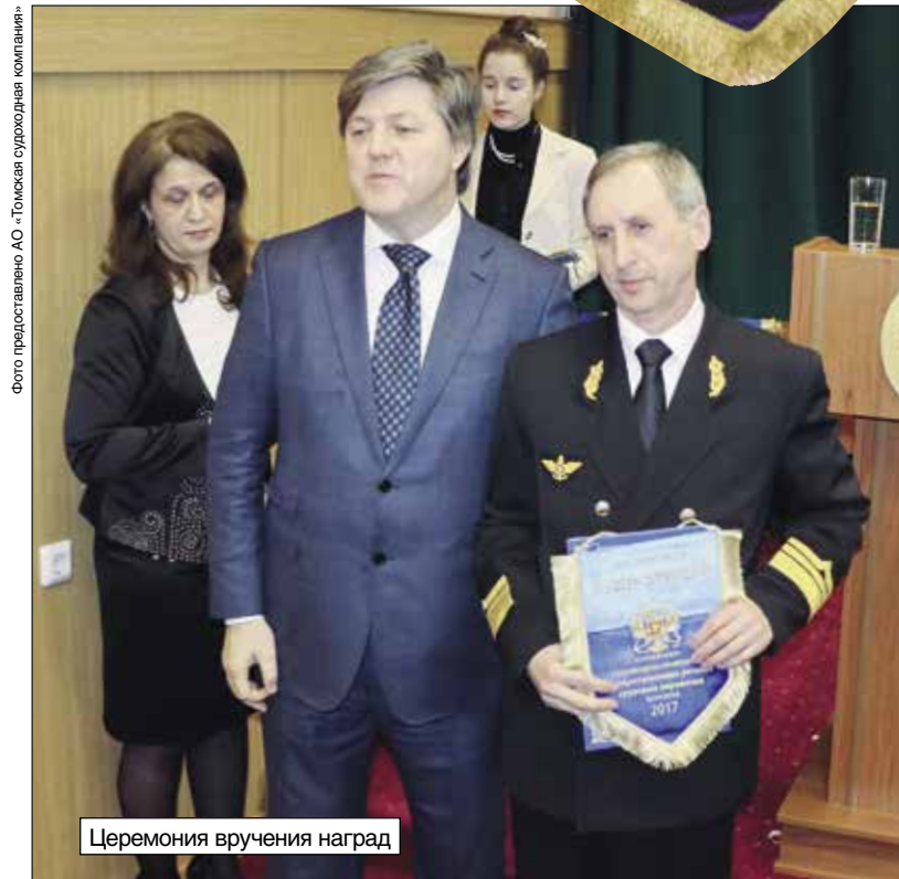
Церемония вручения наград

Также в последние годы шла работа по переходу на долгосрочное сотрудничество с такими нефтяными гигантами, как «Роснефть» и другие. Три года назад впервые был заключен