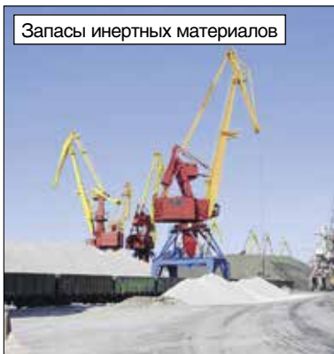
Запасы инертных материалов

— Коллектив берет на себя обязательства и выполняет. А ведь навигации разные бывают, и полноводные, и нет. А если воды мало, обязательства все равно надо выполнять. Вот здесь и проявляются коллективный профессионализм и индивидуальное мастерство.