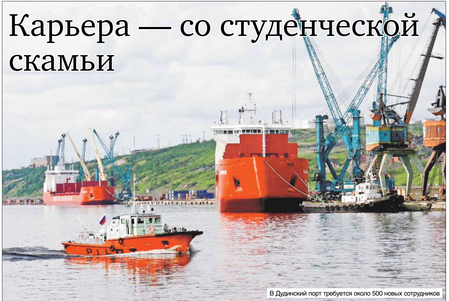
В Дудинский порт требуется около 500 новых сотрудников