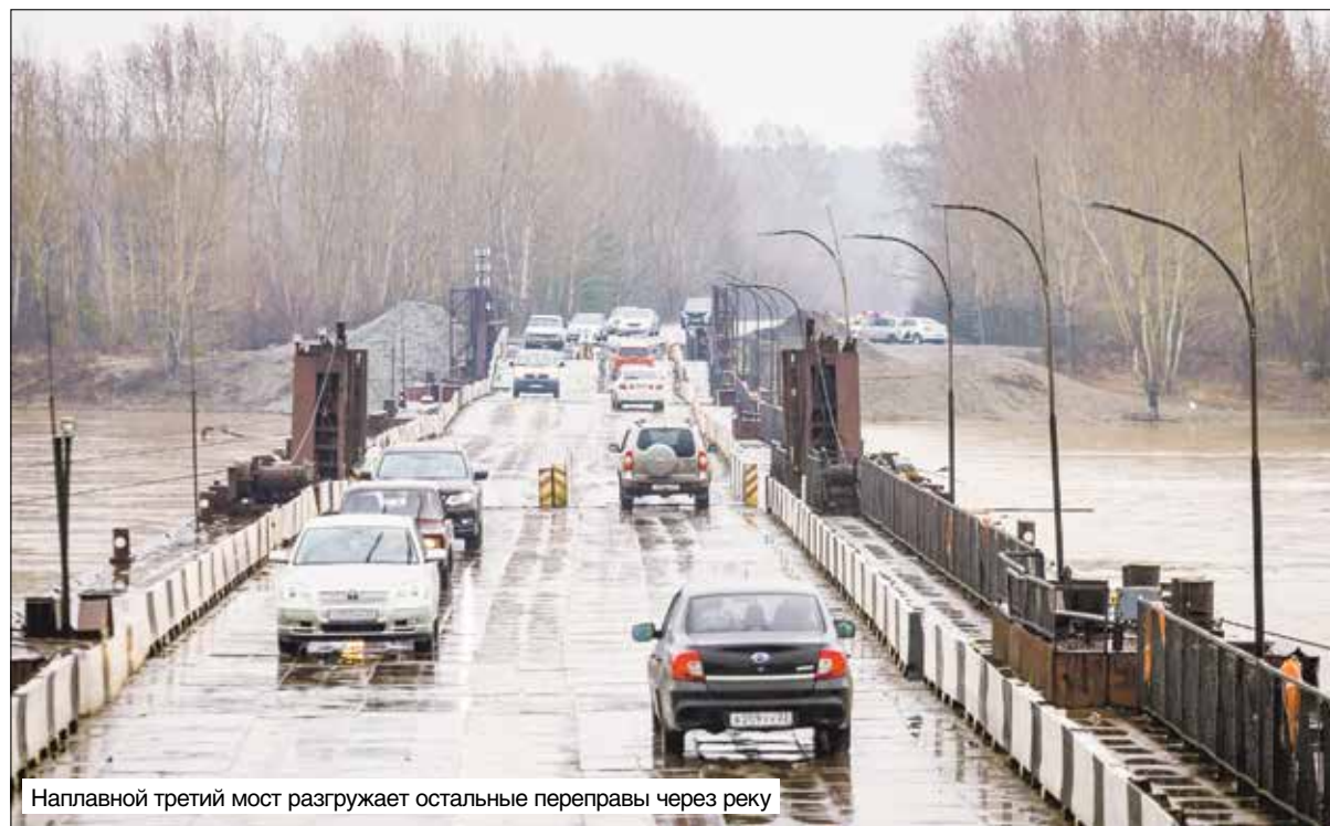
Наплавной третий мост разгружает остальные переправы через реку

В нашей компании парк флота состоит из десяти судов и все они в хорошем состоянии: экипажи стараются беречь технику, на которой работают. Когда подходит очередь ремонта теплохода или баржи, на работу в порт выходит часть экипажа: капитан либо помощник капитана, моторист и еще один-два человека, чтобы подготовить двигатель. Сначала проходит общий осмотр корабля или плавкрана, проверка всех его приборов и систем. При необходимости тут же делают мелкий ремонт, заменяют розетки, кабели и другое.