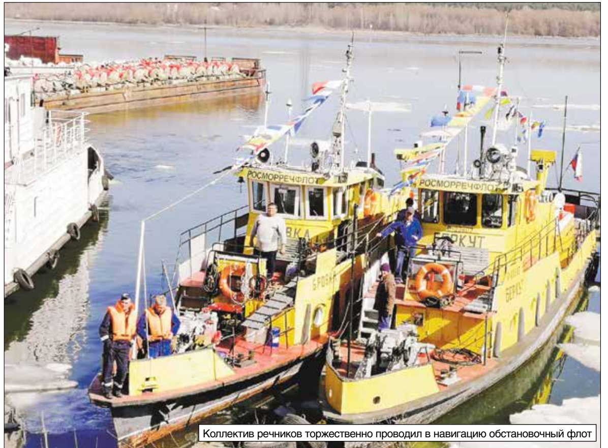
Коллектив речников торжественно проводил в навигацию обстановочный флот