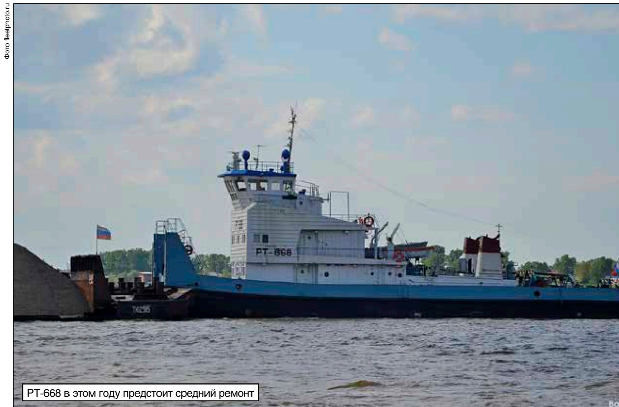
РТ-668 в этом году предстоит средний ремонт

— Наш экипаж, как и РТ-777, работал на верхнем участке. Воды не было на новосибирском участке до устья Томи, вот мы на 1,25 баржи грузили и «ползли» — воды-то было лишь чуть побольше, может, 1,30. Мы встречали теплоходы нашей компании, «налаживали» их до Мысовой, а в Мысовой перегружали — и так все время. В этом году вода ушла совсем рано: то ли снега мало было, то ли накоплений не хватало на ГЭС и воду сбрасывать перестали. Но это не первый год так, бывало и хуже. Конечно, это плохо, когда воды нет, сложно, но мне даже интересно: весь во внимании, сосредоточен. А сложности не пугают!