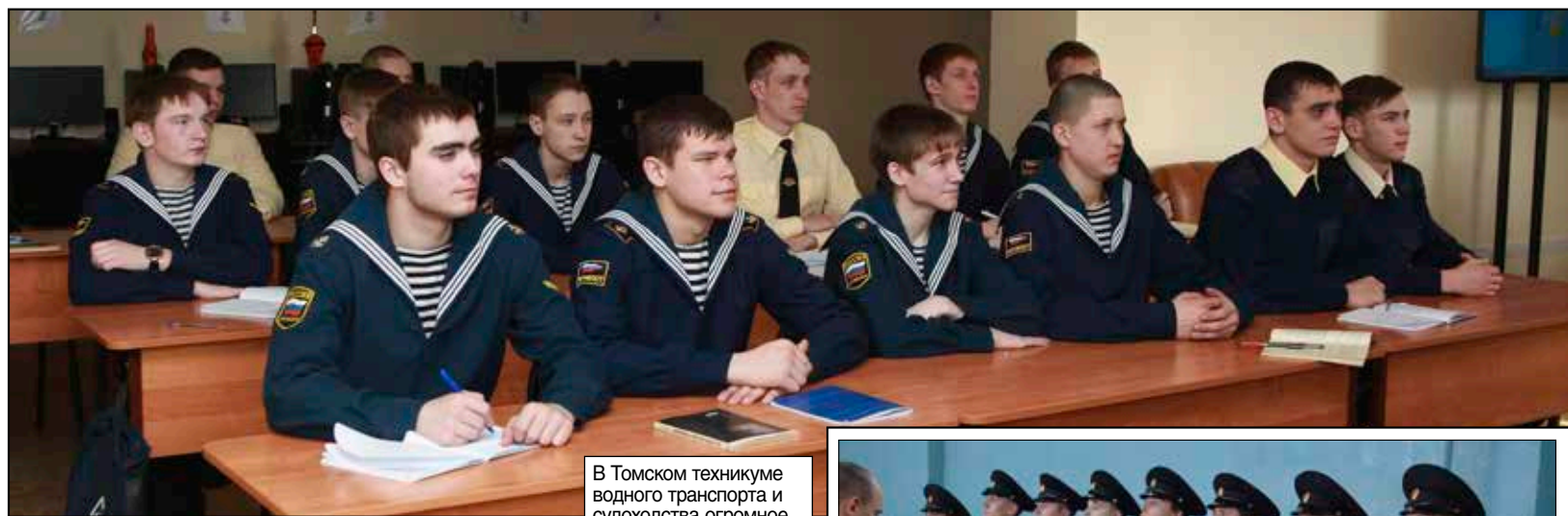
В Томском техникуме водного транспорта и судоходства огромное внимание уделяют производственной практике и спорту.