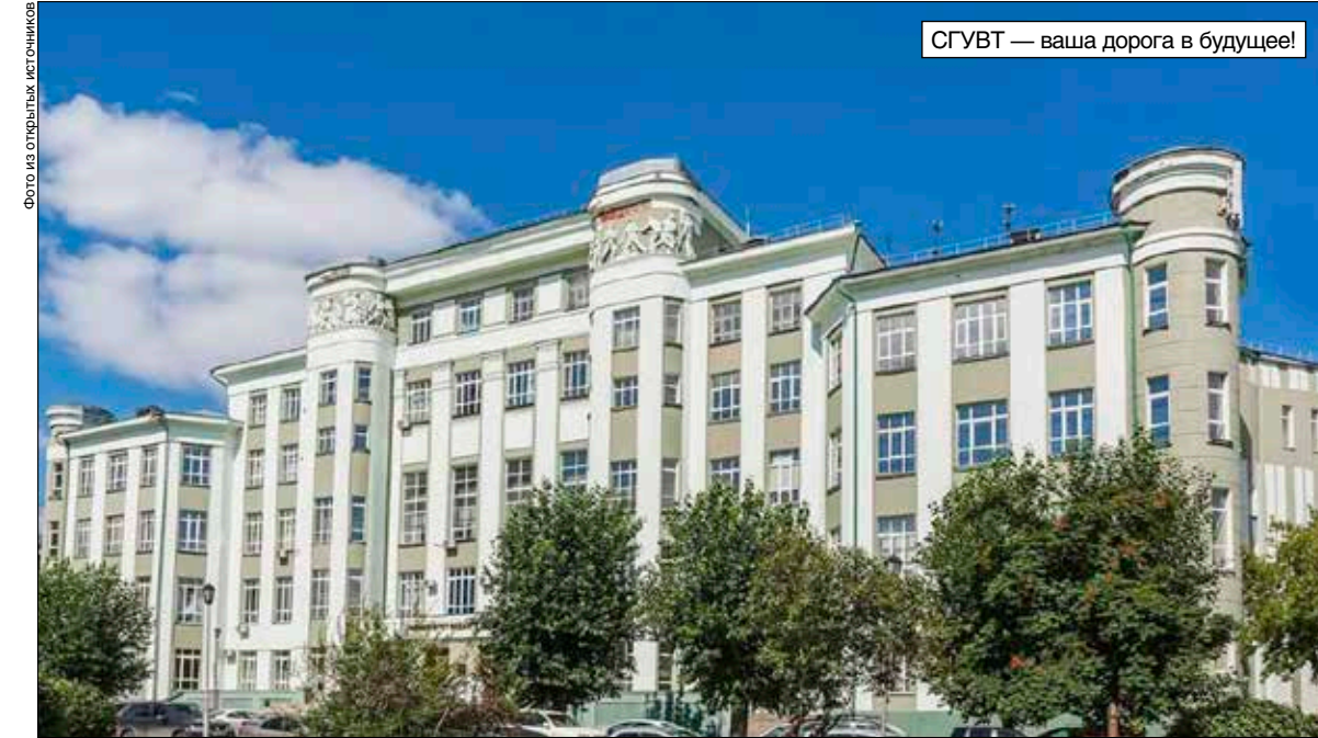
СГУВТ — ваша дорога в будущее!

26.05.05 Судовождение (Судовождение на внутренних водных путях и в прибрежном плавании с правом эксплуатации судовых энер-