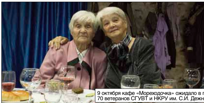
9 октября кафе «Мореходочка» ожидало в гостях около 70 ветеранов СГУВТ и НКРУ им. С.И. Дежнёва