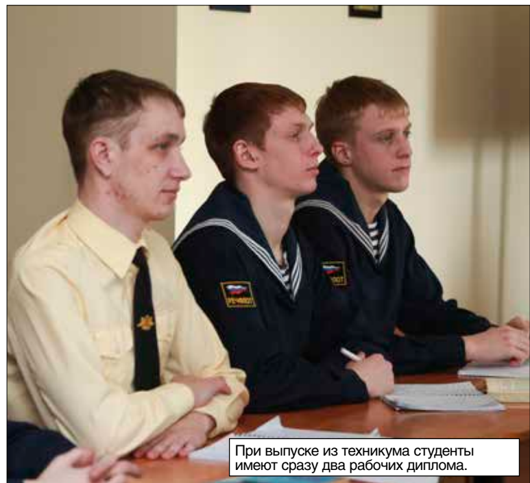
При выпуске из техникума студенты имеют сразу два рабочих диплома.